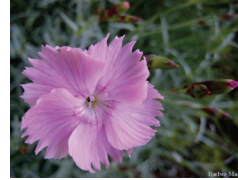
Vänsterpartiets blomma, i full blom – nu är det sommar!

Sture Marklund ställde frågor om vindkraft och hur arbetet med kompensation till bygderna går vidare.