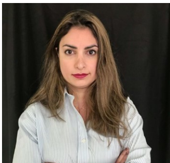
Nooshi Dadgostar, partiledare Vänsterpartiet, kräver folkomröstning om NATO-medlemskap.